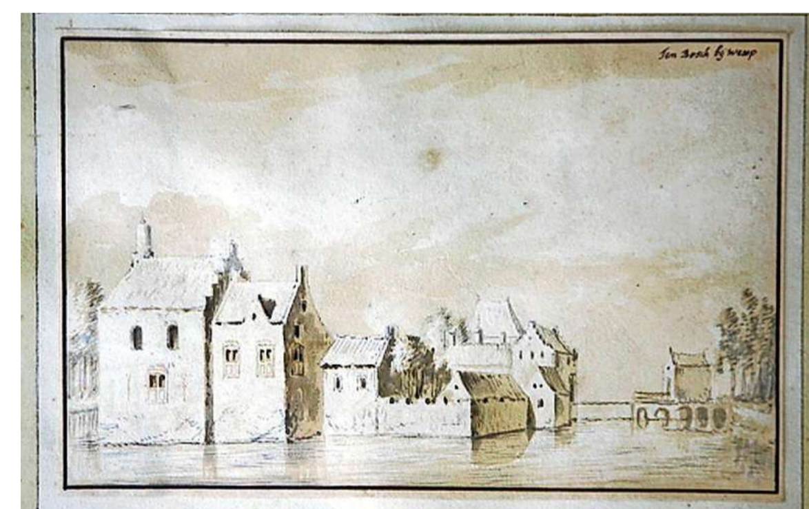
Huis ten Bosch was een complete burcht.

Tijdens de Hoekse en Kabeljauwse twisten wordt het kasteel in